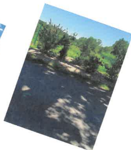
Encore plus de végétation...