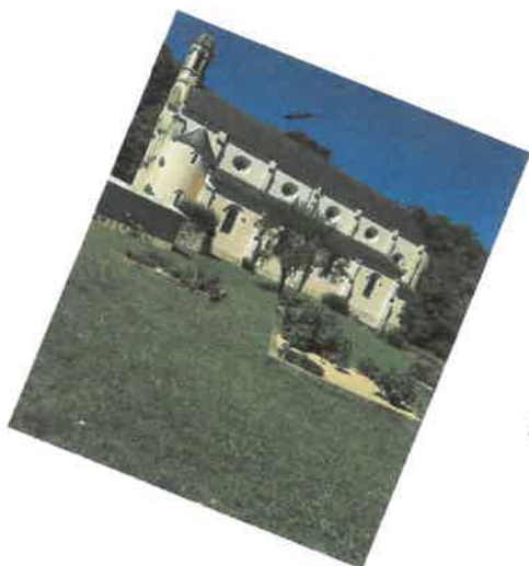
Au jardin des sœurs,

les carrés des simples embaument de mille senteurs