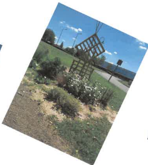
Aux entrées du Châtelet,

les carrés des simples embaument de mille senteurs