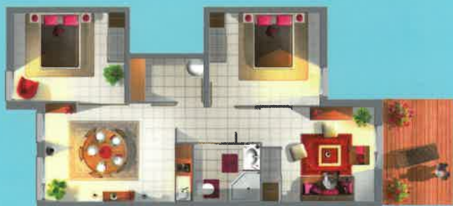
Exemple de maison 4 pièces