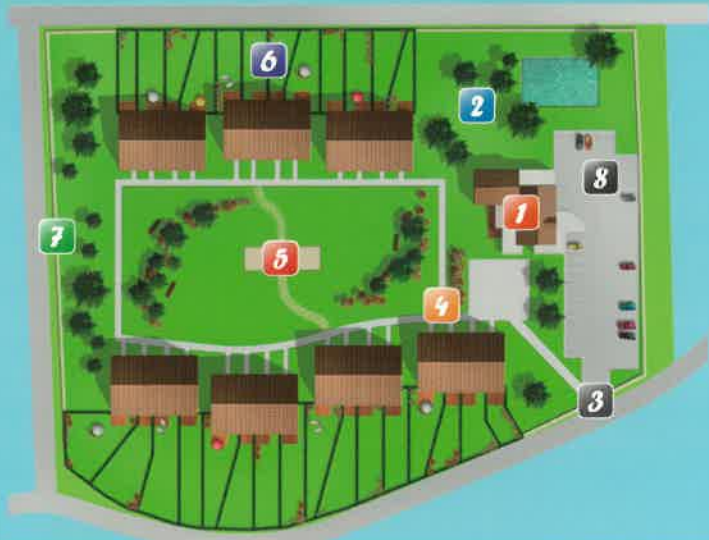
Plan de la résidence