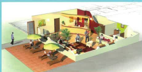
Exemple d'espaces communs